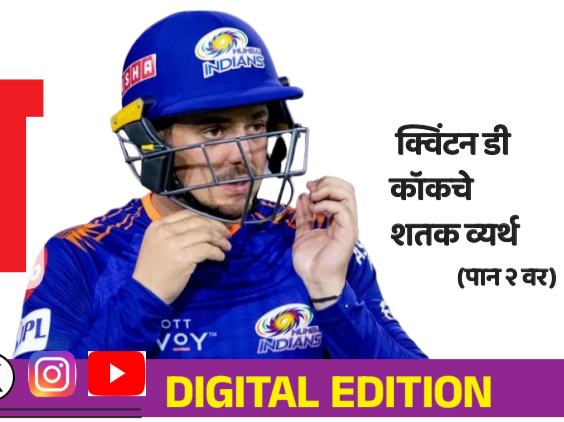
क्विंटन डी कॉकचे शतक व्यर्थ (पान २ वर)