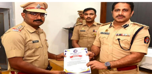
आढळून आला होता. या घटनेने परिसरात खळबळ उडाली होती. पोलिसांनी तत्काळ घटनास्थळी धाव घेत पंचनामा करून तपासाची सूत्रे हाती घेतली. तपासादरम्यान पोलिसांनी फिर्यादी महिला व साक्षीदारांचा शोध घेत घटनाकामची सखोल माहिती मिळवली. विविध तांत्रिक आणि मानवी स्रोतांचा वापर करत आरोपीचा माग काढण्यात आला. गुन्हा दाखल होताच पोलिसांनी जलद गतीने तपास करत संशयिताला ताब्यात घेतले आणि चौकशीतून गुन्हाची उकल केली. त्यानंतर आरोपीस अटक करण्यात आली. विशेष म्हणजे अटक करण्यात आलेला आरोपी हा