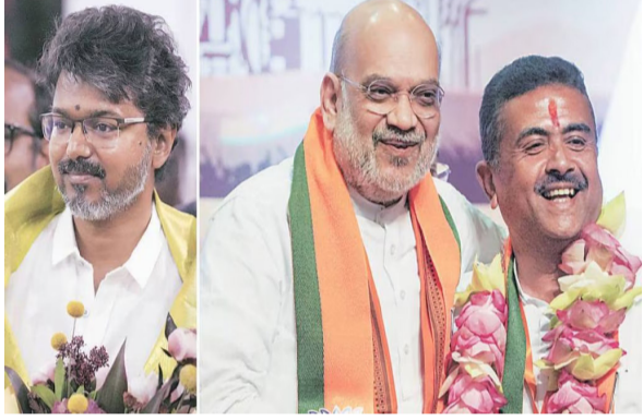
टीव्हीकेला बहुमतासाठी १० जागांची आवश्यकता होती. कॉंग्रेस, माकप व भाजप यांनी पाठिंबा दिल्याने 'टीव्हीके' बहुमताच्या जवळ पोहोचली आहे. प्रत्येक दोन जागा जिंकलेल्या व्हीसीके व इंडियन युनियन मुस्लीम लीगने पाठिंब्याचे संकेत दिले असल्याने विजय यांचा सरकार स्थापनेचा मार्ग मोकळा झाला. डाव्या पक्षांनी बिनशर्त पाठिंबा जाहीर केल्यानंतर टीव्हीके प्रमुख विजय यांनी सरकार स्थापन करण्यासाठी निमंत्रण मिळाले, यासाठी शुक्रवारी लोकभवनात राज्यपाल राजेंद्र विश्वनाथ अर्लेकर यांची भेट घेतली. यावेळी राज्यपालांनी विजय यांना सत्ता स्थापन करण्यास मंजूरी दिली. राज्यपालांची भेट घेतल्यानंतर विजय यांनी भाजप आणि माकप कार्यालयांना भेट घेत सरकार स्थापन करण्यासाठी पाठिंबा दिल्याबद्दल आभार मानले.

दुसरीकडे पश्चिम बंगालमध्ये अपेक्षेप्रमाणे भाजपचे ज्येष्ठ नेते सुवेंदू अधिकारी यांची विधिमंडळ पक्षनेते पदी निवड करण्यात आली असून शनिवारी ते मुख्यमंत्रीपदाची शपथ घेतल. ते पश्चिम बंगालमधील भाजपचे पहिलेच मुख्यमंत्री असणार आहेत. तमिळनाडू विधानसभेच्या निवडणुकीत सर्वाधिक १०८ जागा जिंकून विजय यांचा 'तमिळग वेत्री कळघम' (टीव्हीके) हा सर्वात मोठा पक्ष ठरला. मात्र सरकार स्थापन करण्यासाठी आवश्यक ११८ च्या बहुमताच्या आकड्यापासून हा पक्ष दूर होता.