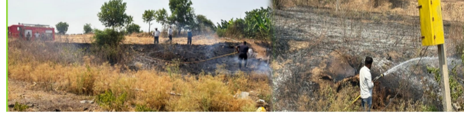
यामुळे आग झपाट्याने पसरू लागली. आगीच्या ज्वाळा वाढत असल्याचे लक्षात येताच परिसरातील शेतकरी आणि नागरिकांनी घटनास्थळी धाव घेतली. वाऱ्याचा वेग अधिक असल्याने आग थेट शेतीपर्यंत पोहोचण्याची भीती निर्माण झाली होती. त्यामुळे शेतकऱ्यांमध्ये काही काळ घबराटीचे वातावरण होते. दरम्यान, घटनेची माहिती मिळताच वरणगाव

वरणगाव | प्रतिनिधी: भुसावळ तालुक्यातील विल्हाळे शिवारात सोमवारी दुपारी अचानक झाडाझुडपांना आग लागल्याने परिसरात एकच खळबळ उडाली. विल्हाळे तलावाकडे जाणाऱ्या नाल्याला लागलेल्या आगीने काही वेळातच रौद्ररूप धारण करीत जवळीक केळीबागांना मोठा धोका निर्माण झाला होता. मात्र वरणगाव नगरपालिकेच्या अग्निशमन दलाने वेळीच धाव घेत आग आटोक्यात आणल्याने मोठी हानी टळली. सोमवारी दुपारी सुमारे २ वाजेच्या सुमारास ही घटना घडली. उन्हाची तीव्रता आणि परिसरातील कोरडी झुडपे व गवत नगरपालिकेचे अग्निशमन दल तातडीने घटनास्थळी दाखल झाले. अग्निशमन कर्मचाऱ्यांनी पाण्याचा जोरदार मारा करत आग नियंत्रणात आणण्यासाठी शर्थीचे प्रयत्न केले. स्थानिक नागरिकांनीही आग विझविण्यासाठी मदत केली. अखेर मोठ्या प्रयत्नांनंतर आग पूर्णपणे आटोक्यात आणण्यात यश आले. या आगीत कोणतीही जीवितहानी झाली नसली तरी मोठ्या प्रमाणात झाडाझुडपे आणि कोरडे गवत जळून खाक झाले. सुदैवाने जवळीक केळीबागा मोठ्या नुकसानीपासून वाचल्या. आग लागण्याचे नेमके कारण अद्याप स्पष्ट झालेले नाही. उन्हाळ्याच्या दिवासात वाढती उष्णता आणि कोरडे गवत यामुळे अशा प्रकारच्या आगीच्या घटना वाढत असल्याने नागरिकांनी सतर्क राहण्याचे आवाहन प्रशासनाने केले आहे.